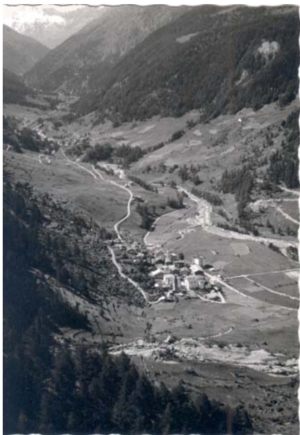
Degioz nel 1968