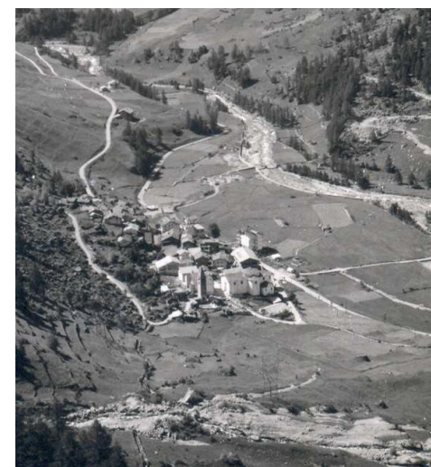
Non sarà stata come la Piana di S. Orso, però...