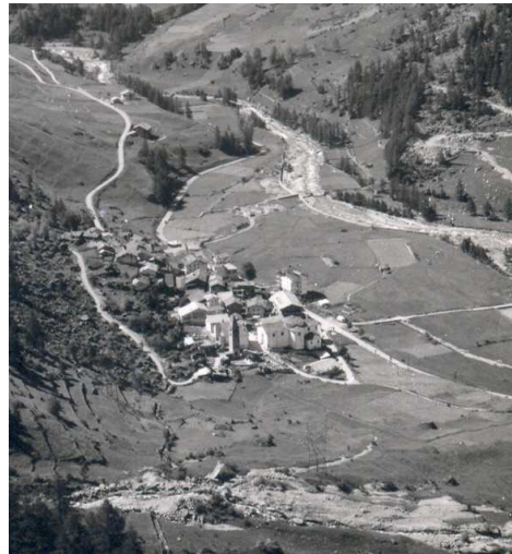
Non sarà stata come la Piana di S. Orso, però...